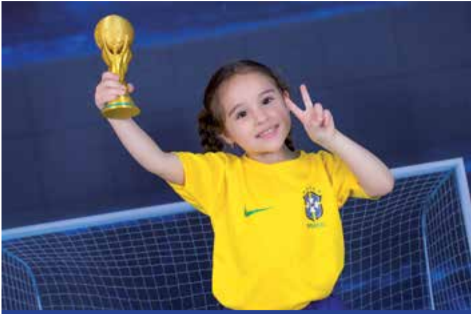
Torcida renovada pelo sonho do hexa

A Seleção Brasileira de Futebol inicia nesta segunda-feira (29) sua caminhada na fase eliminatória da Copa do Mundo FIFA 2026. Após terminar a fase de grupos na liderança do Grupo C, a equipe entra em campo pelas oitavas de final em busca de seguir viva na disputa pelo hexacampeonato.