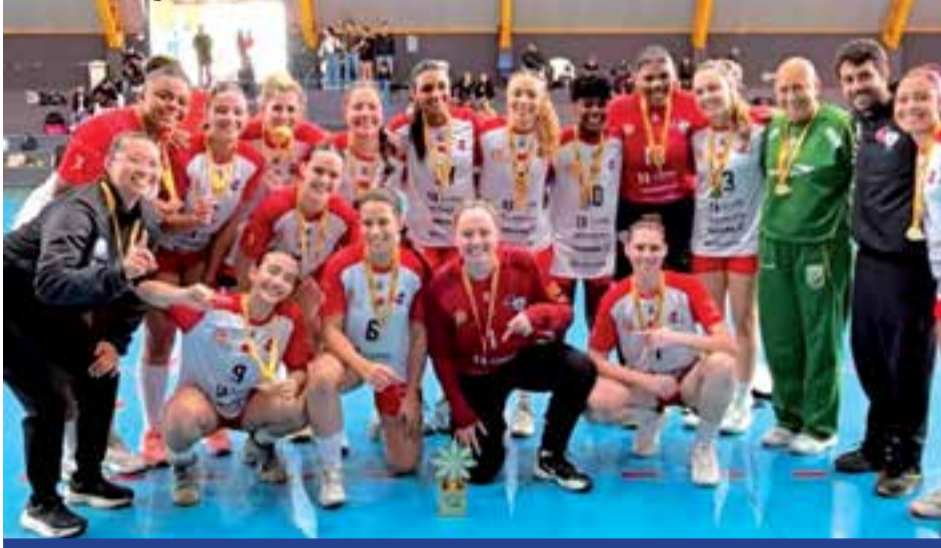
Handebol Feminino presente nos JAPs

A 68ª edição dos Jogos Abertos do Paraná (Japs) teve a conclusão da fase Regional neste último fim de semana, com as três equipes londrinenses sendo campeãs em Ibiporã. Londrina garantiu mais três classificações para a sequência dos Jogos Abertos do Paraná (Japs) 2026. As equipes de futebol 7 masculino, handebol feminino e voleibol masculino conquistaram os títulos da fase Regional, realizada em Ibiporã, e avançaram para a etapa Macrorregional da competição.