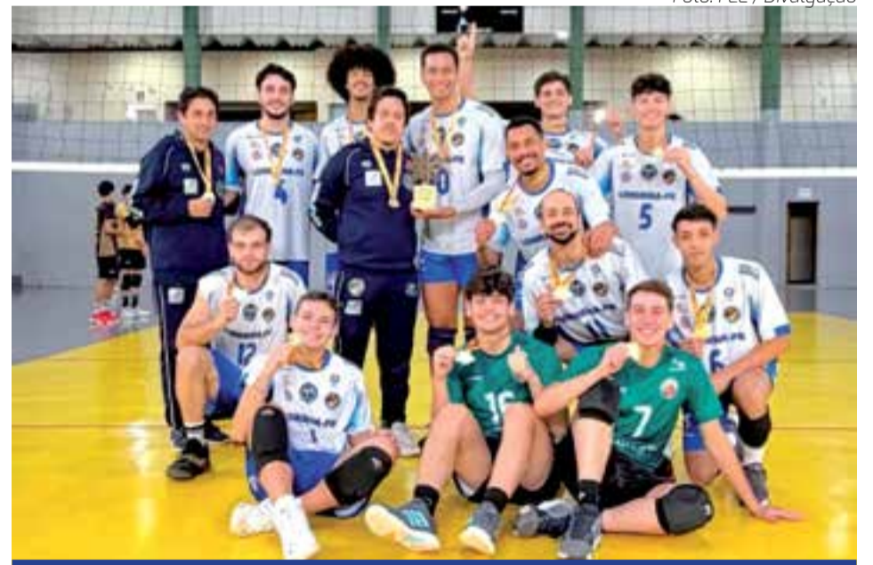
Equipe de Volei Masculino